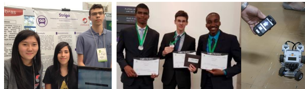
Alunos na Bragantec 2016

Nossos alunos desenvolvem vários projetos de software no decorrer do curso. São incentivados a inscrever seus projetos nas mais variadas feiras e mostras de trabalhos técnicos do Brasil e internacionais, como 3M, Febrace, Fenecit, Mostratec, Bragantec, Bentotec, Experiência Beta, ISEF, dentre outras. Esses eventos são realizados em diversas cidades e auxiliam a desenvolver as competências dos alunos para resolução de problemas, autonomia, sociabilização e preparação para o mundo do trabalho e da pesquisa científica.